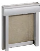
Tenda tecnica anti-vento