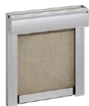
Tenda tecnica anti-vento