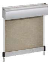
Tenda tecnica anti-vento