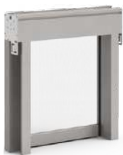
Zanzariera verticale anti-vento