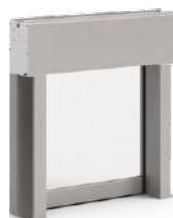
Zanzariera verticale anti-vento