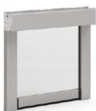
Zanzariera verticale anti-vento