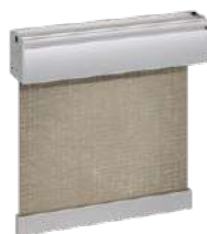
Tenda tecnica anti-vento