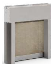
Tenda tecnica anti-vento